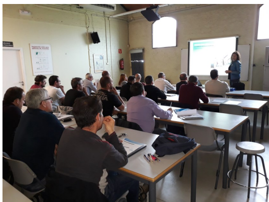
Curs Oficial d'instal·lador de punts de recàrrega