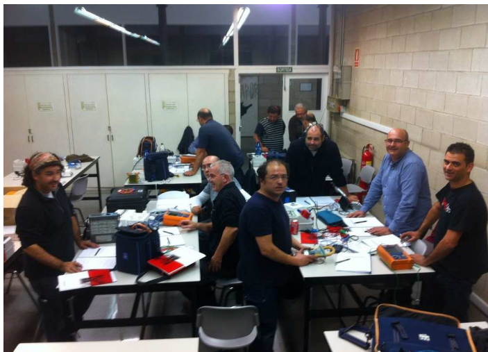
Curs: Mesures Elèctriques